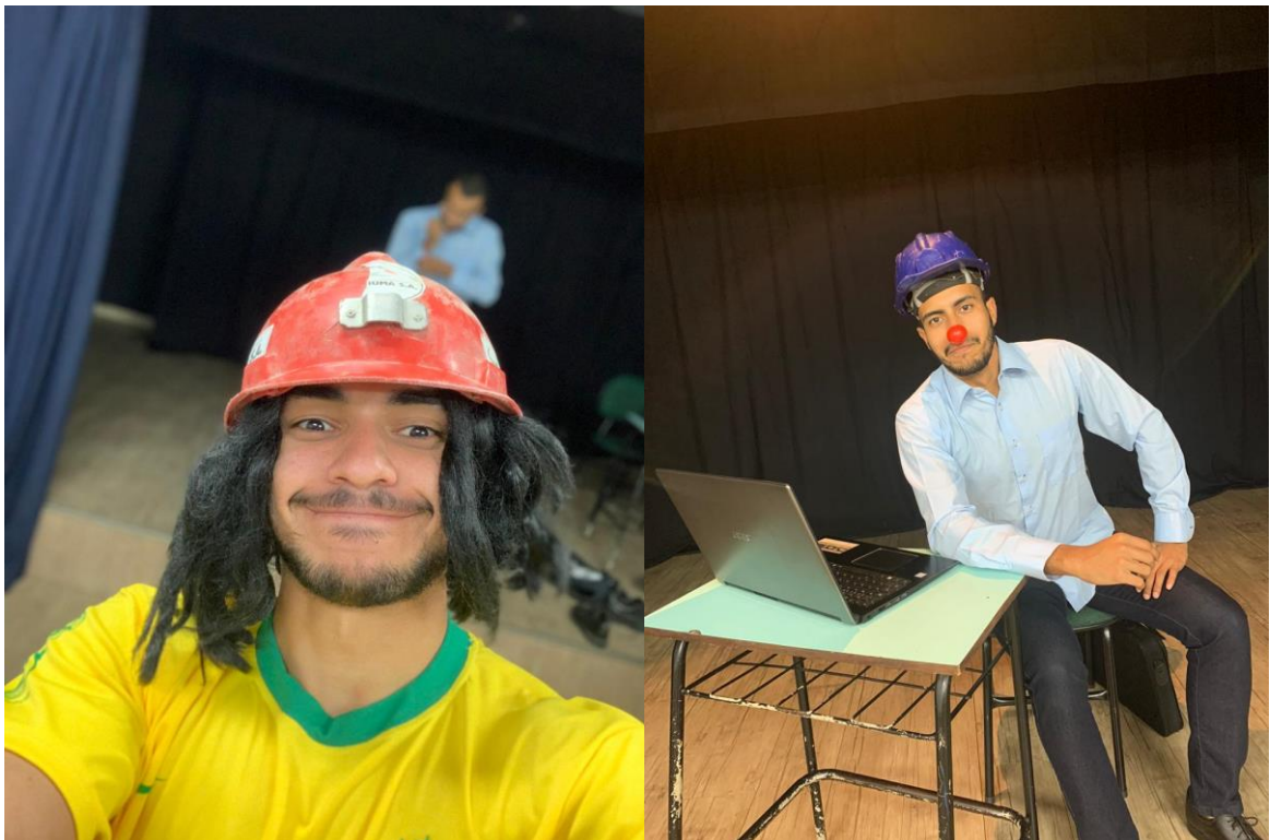
Figura 6 - Durante o ensaio

Após o ensaio, assistimos o que foi gravado e decidimos experimentar movimentações diferentes em palco, como permanecíamos muito parados em cena, achamos que não estávamos usando o total espaço que o palco tem a oferecer, limitando as ações dos personagens.