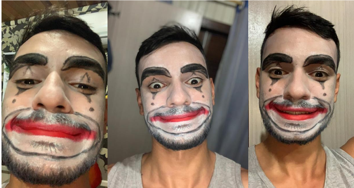
Figura 2 - Prévia da maquiagem do Caniço.