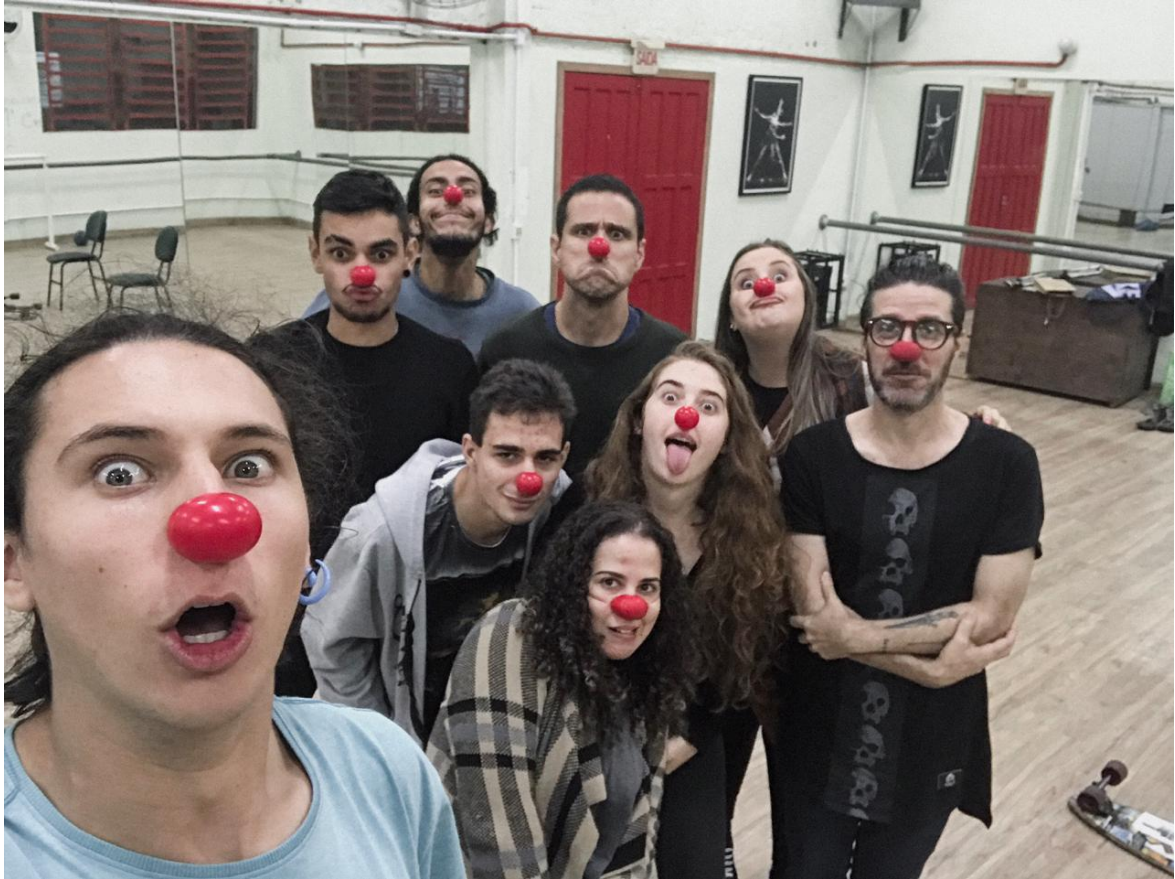
Figura 4 - Oficina de palhaço

ensaios e a partir disso criar movimentos; e entrar em cena caracterizado com as máscaras do palhaço, o nariz, buscando sentir a plateia, sua reação e vale salientar que isso foi feito nos últimos momentos da oficina.