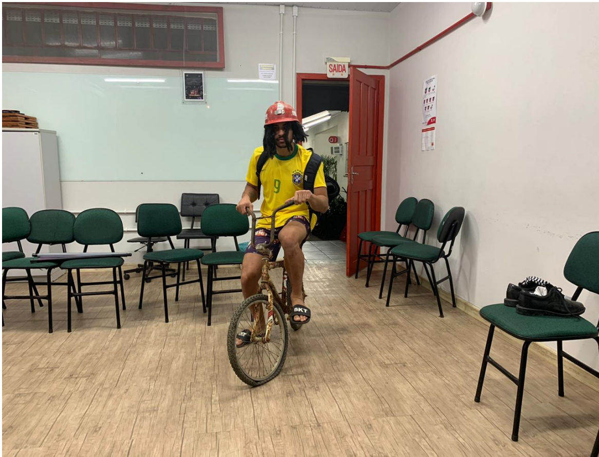
Figura 7 - Antes do ensaio