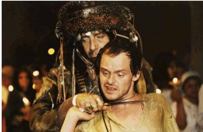
Figura 6 – Foto divulgação do filme - 2000