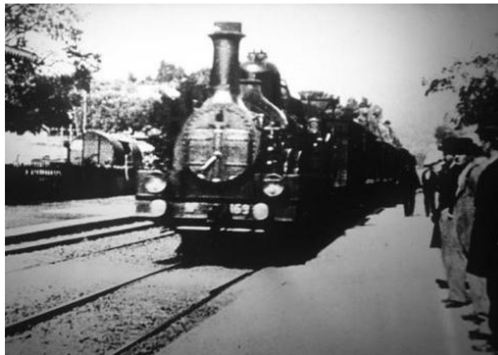
Figura 4 - L'arrivée D'um Train Em Gare de La Ciotat - 1895