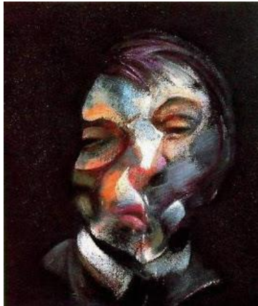
Figura 3 – Autorretrato - 1971 - Francis Bacon