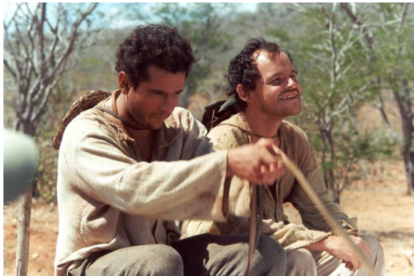
Figura 5 – O auto da compadecida - 2000