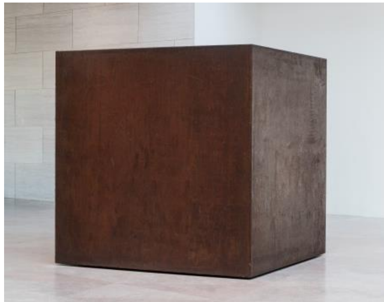
Figura 1 – "Die" – Tony Smith (1961)