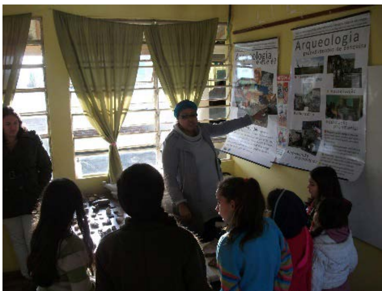
Figura 10 – Explicação para os alunos da Escola Estadual de Ensino Fundamental Santa Eulália.

Estiveram presente não só os alunos da escola Santa Eulália – o convite da direção para participação nesse evento foi estendido a toda comunidade e as escolas do entorno – mas também aos membros da Escola Erasmo Braga, aos pais e mães dos alunos e alunas e à comunidade em geral, tendo participado uma média de 130 pessoas. Na exposição foram dispostos banners sobre as etapas do trabalho e da pesquisa arqueológica e foi organizada uma exposição de materiais do período pré-colonial coletados em Pelotas e foram distribuídos exemplares do livreto infantil de educação patrimonial.