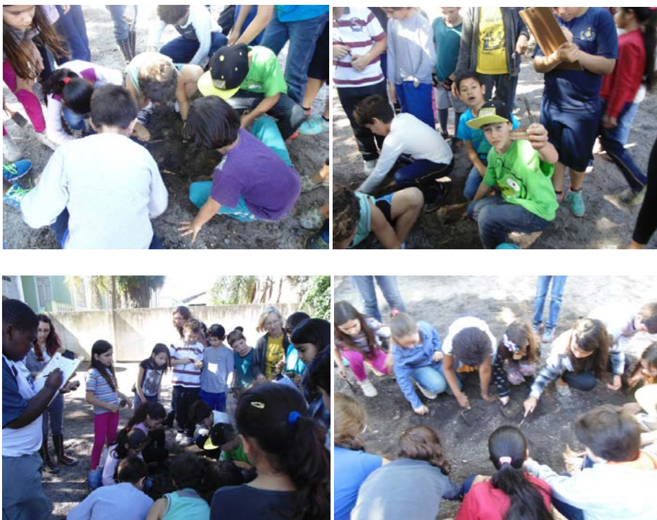
Figuras 5 a 8 – Fotos das crianças durante a escavação simulada, registrando material retirado da terra.

Também no ano de 2014 foi organizado um conjunto de atividades na Escola Félix da Cunha com turmas de 4º, 5º e 6º anos, somando-se 159 alunos presentes nas atividades que duraram três dias. As atividades foram demandas pela escola, já que a professora responsável pelas turmas viu na Educação Patrimonial uma maneira de complementar o ensino de história e geografia para os alunos. Foi apresentado um conjunto de slides falando rapidamente o que é arqueologia e mostrando artefatos arqueológicos utilizados na história pré-colonial regional, junto com ilustrações da utilização dos mesmos. Num segundo momento da atividade foi realizada uma escavação arqueológica no pátio da escola, onde a equipe do LEPAARQ inseriu artefatos em pequenas quadrículas em que, munidos de ferramentas utilizadas em escavações, os alunos tiveram que os encontrar. Utilizando o que haviam visto nos slides, eles identificavam o material e sua função. Os alunos também haviam feito desenhos sobre o que entendiam ser a arqueologia, resultando em um material de retorno da atividade.