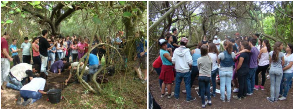
Figuras 1 e 2 – Visitação de turmas de alunos da escola Escola Dom Francisco de Campos Barreto ao cerrito PSG-01 durante escavação arqueológica realizada pela equipe do LEPAARQ-UFPEL.