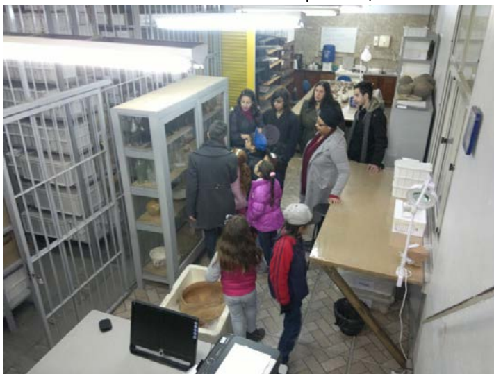
Figura 9 – Alunos da Escola Doutor José Bresque Filho, visitando o LEPAARQ.

Após conhecerem os cômodos e as pesquisas realizadas pelo laboratório, voltaram para a sala de curadoria onde estavam dispostos alguns artefatos pré-coloniais sobre a mesa e foi feita uma dinâmica para reconhecimento desses materiais. Esses alunos já haviam participado de ações educativas sobre o patrimônio cultural e por esse motivo reconheceram com facilidade os artefatos.