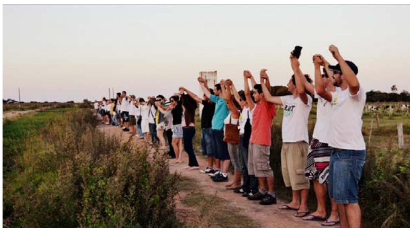
Figura 13 – Foto de membros do Movimento Pontal Vivo em uma ação de protesto em defesa do banhado do Pontal da Barra.

Essas decisões políticas que se desdobraram em normativas jurídicas, reforçam as ações de reivindicação para a preservação do patrimônio cultural no município de Pelotas, através do Movimento Pontal Vivo, que surgiu em função da defesa do Pontal da Barra. Esse movimento atua de maneira autônoma, sem vinculações partidárias, interagindo através de redes sociais, reuniões presenciais para tomada de decisões e ações públicas, como protestos, exposições de fauna e flora e materiais arqueológicos que compõem o patrimônio ambiental e cultural do Pontal. Além de ações públicas que buscam sensibilizar a sociedade pelotense sobre a importância do Pontal da Barra, o Movimento Pontal Vivo organizou dois seminários nos anos de 2012 e 2014. Esses eventos foram de cunho acadêmico, mas tiveram ampla repercussão social. Deles, participaram técnicos, ambientalistas e representações políticas locais, no intuito de discutir os aspectos legais do empreendimento, publicizar o patrimônio ambiental e cultural e pensar em estratégias de resistência e luta contra a destruição do banhado do Pontal da Barra.