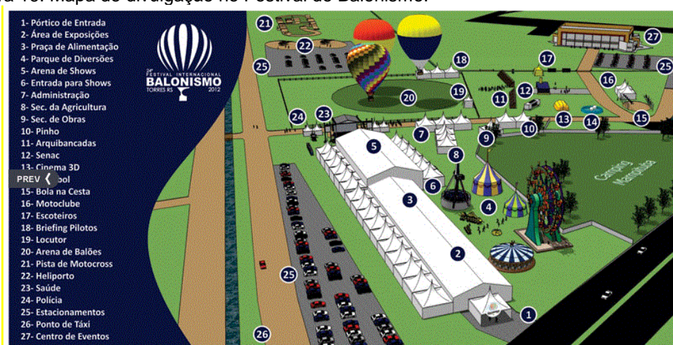
Figura 16. Mapa de divulgação no Festival de Balonismo.