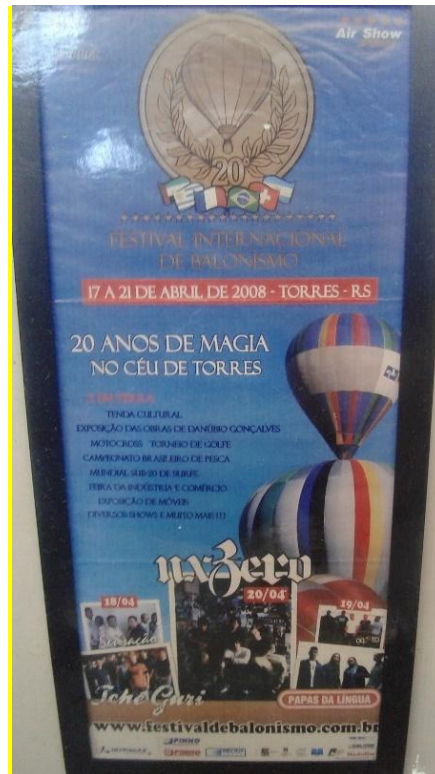
Figura 23. Material de divulgação do Festival de balonismo.