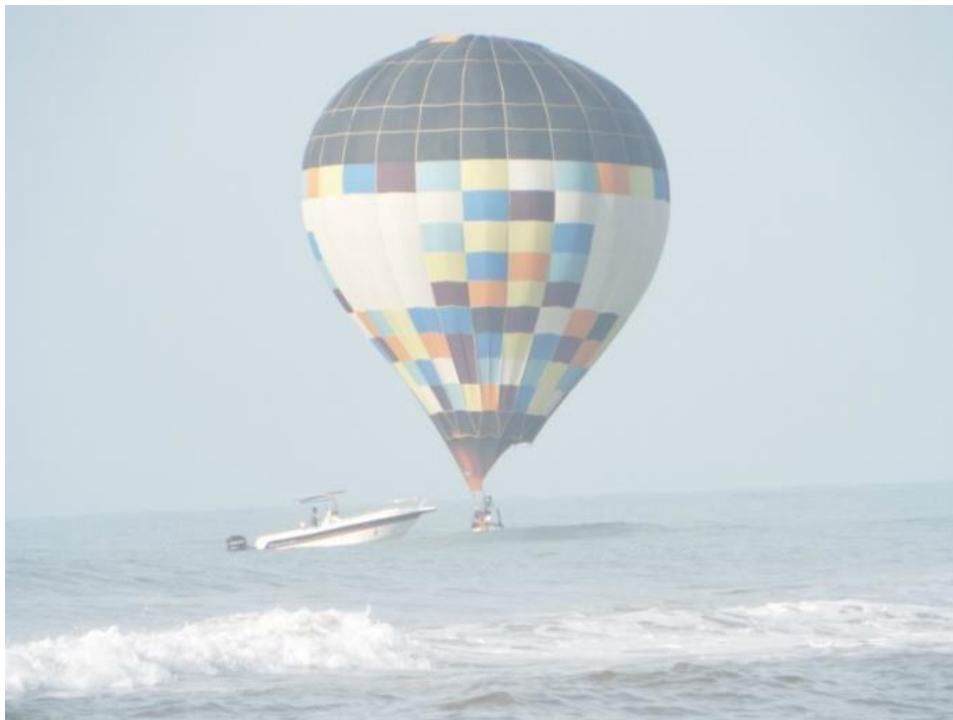
Figura 18. Balão no resgatado no mar.

Relatos de acidentes com balões na cidade são bem raros, o mais recente foi em 2016, quando quatro balões depois de uma decolagem, levaram um grande susto quando uma rajada muda a direção dos balões os levando para a praia da Itapeva. Bombeiros e equipes participantes do festival, juntos resgataram os pilotos e passageiros, e também os equipamentos. Sendo que dos quatros somente um balão teve um início de incêndio após tocar o mar, o segundo manteve-se inflado e foi resgatado, sendo puxado até a beira da orla, os outros dois pousaram na beira mar sofrendo nenhum tipo de dano (Figuras 18, 19 e 20).