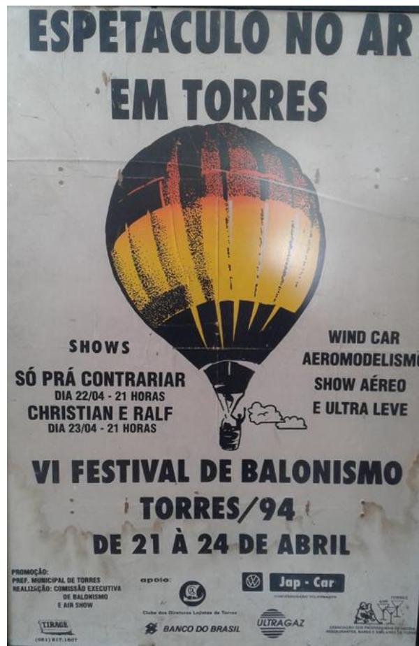
Figura 12. Slogan de divulgação do balonismo em 1994, Torres/RS.