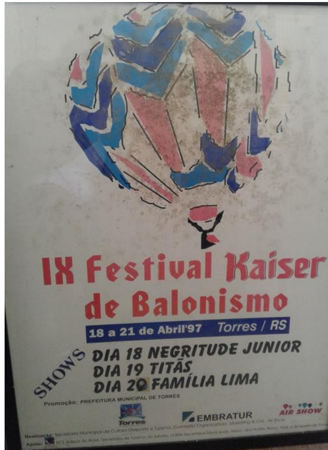
Figura 13. Slogan de divulgação do balonismo em 1997, Torres/RS