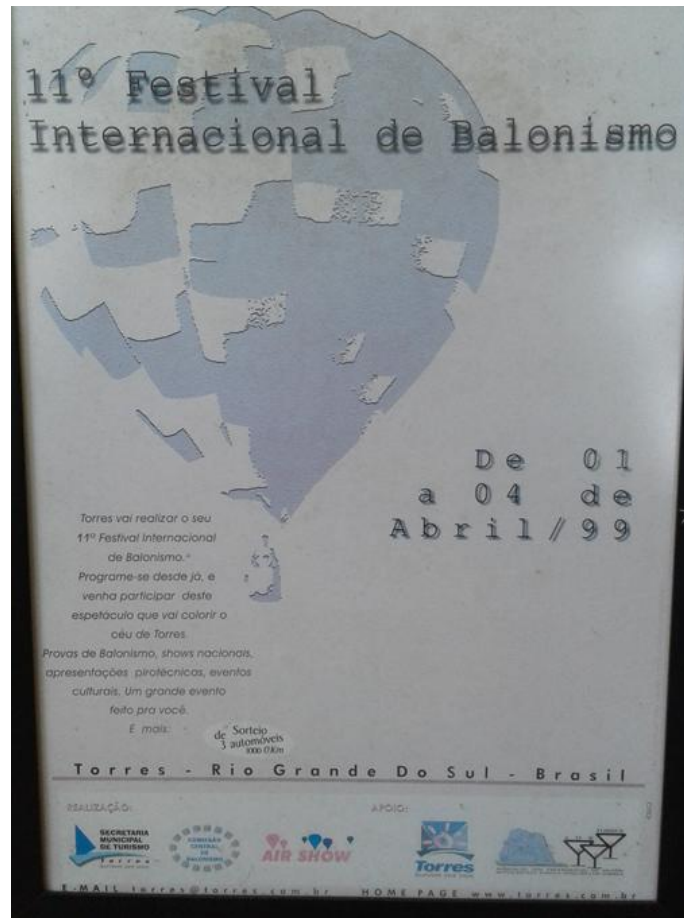
Figura 14. Slogan de divulgação do balonismo em 1999, Torres/RS.