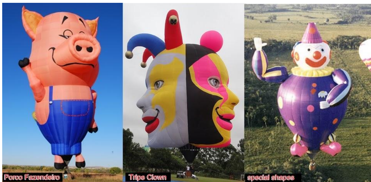
Figura 7. Modelos de Balões.

Há também atrações como show nacionais, feiras de artesanatos locais e praça de alimentação, espetáculos de voo de pára-quedistas profissionais, há a alguns anos a organização convida o grupo da FAB-Força Aérea Brasileira conhecida como esquadrilha da fumaça. Durante os voos de balões é possível prestigiar também os balões de formas que fazem com que a paisagem que é deslumbrante ficar mais colorida e animada. A cada ano que passa os organizadores tendem a surpreender cada vez mais seus visitantes com novas formas de balões, neste ano de 2017, foi possível prestigiar os balões de forma de cegonha considerado o maior do mundo em forma horizontal e o de Jesus Cristo medindo um total de 42 metros cúbicos de gás. Não deixando de citar aqueles que já marcam presença todos os anos, como o do porco fazendeiro, galinha pintadinha, Tripe Clown e o do palhaço que já é um marco na história do festival (Figura 7).