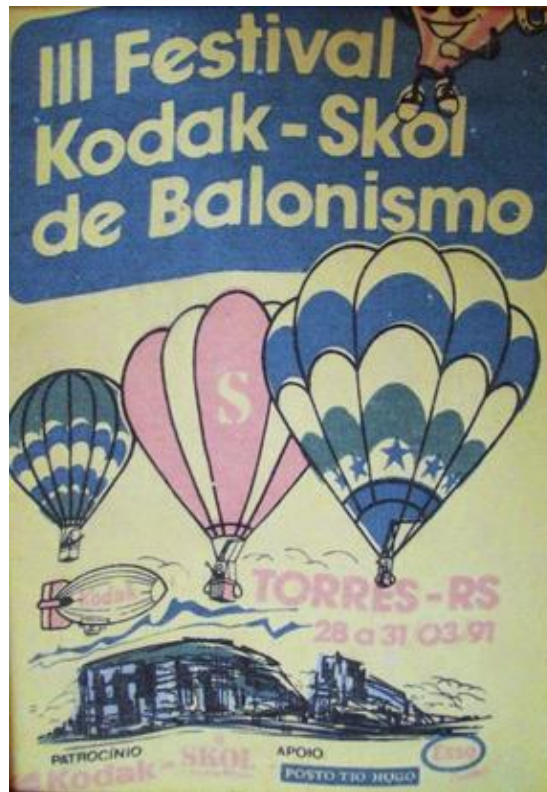
Figura 11. Slogan de divulgação do balonismo em 1991, Torres/RS.