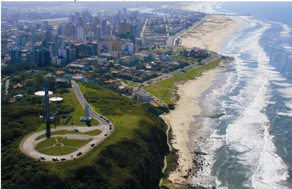
Figura 4. Vista aérea do município de Torres, 2017.