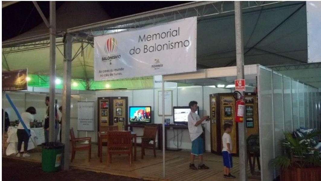
Figura 15. Exposição em evento do balonismo em Torres, edição 2012.

festival de balonismo (Figura 15), imagem abaixo nos ilustra a exposição do memorial na edição de 2012.