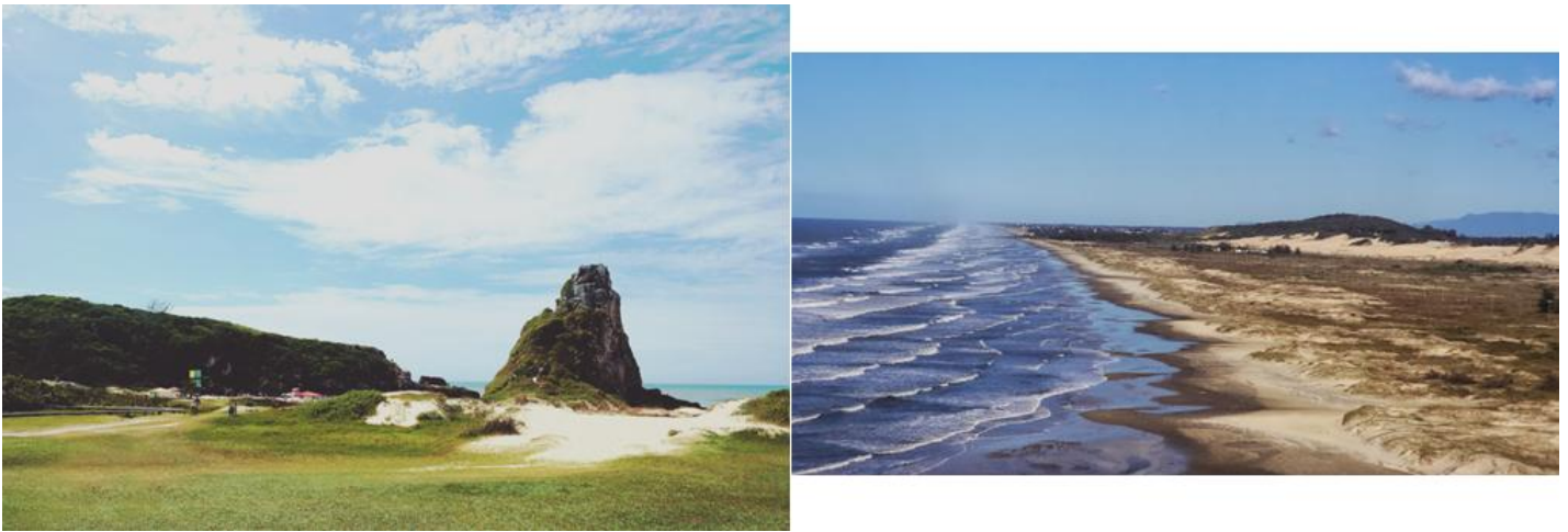
Figura 5. Praia da Guarita e Parque da Itapeva

“(…) o congelamento do gesto e da paisagem, (e porque não dizer, das individualidades) e, portanto a perpetuação de um momento, em outras palavras, da memória: memória do indivíduo, da comunidade, dos costumes, do fato social, da paisagem urbana, da natureza. A cena registrada na imagem não se repetirá jamais. O momento vivido, congelado pelo registro fotográfico, é irreversível”. (KOSSOY. 2003: 155)