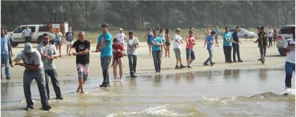
Figura 19. Retirada de um balão na praia de Torres, com a ajuda da comunidade.