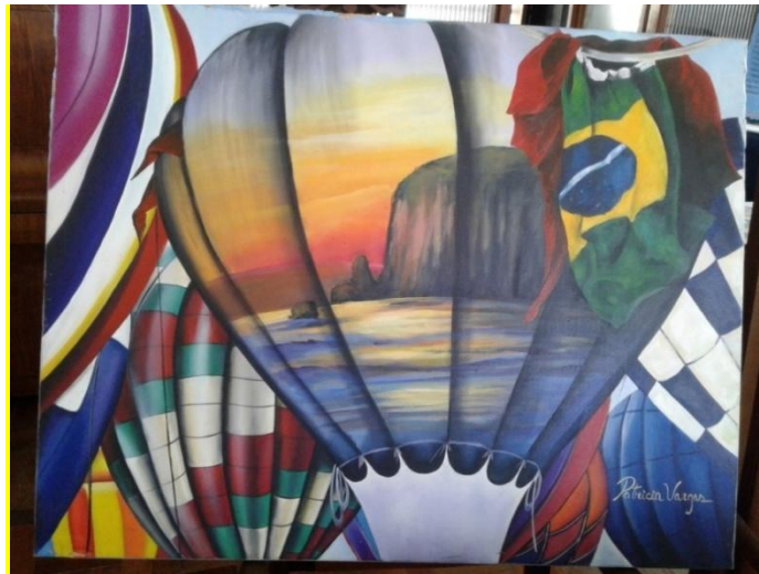
Figura 21. Quadro de pintura do Festival de Balonismo.