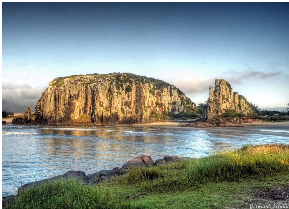
Figura 10. Ponto de vista da praia da Guarita/Torres-RS.

Esse imponente promontório, cujas encostas debruçam-se sobre as águas do Oceano Atlântico, é a famosa “Torre do Meio”, constitui-se na mais extensa formação basáltica junto ao mar na região. Os paredões abruptos conferem ao lugar um ponto turístico misto de medo e beleza natural, cuja base é constantemente açoitada pelas ondas do mar. (BATISTA, p.52. 2012)