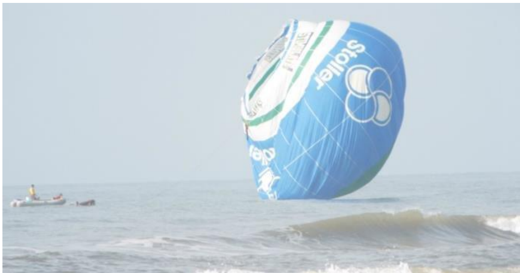
Figura 20. Retirada do balão do mar.