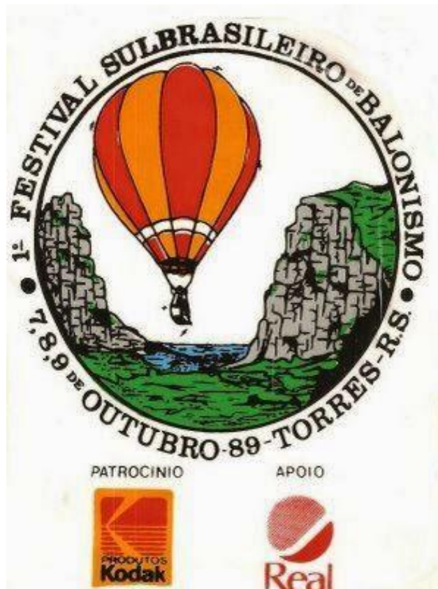
Figura 9. Slogan de divulgação do Balonismo em Torres/1989.