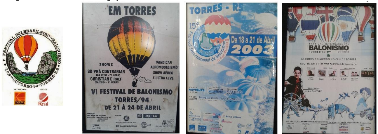
Figura 17. Materiais de divulgação do Festival de Balonismo em Torres/RS.