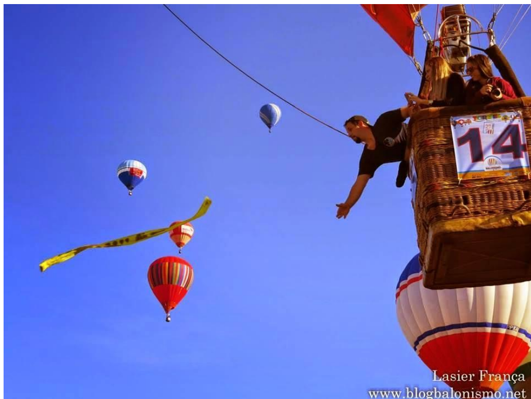
Figura 8. Prova de Fly In do balonismo.

Já outra prova que dificulta muita a vida dos pilotos é a Fly In , essa prova é quando feita a medição do vento para ver seu direcionamento, é determinado um local para um alvo em forma de X em um campo aberto, muitas vezes, dentro do próprio campo do evento, os pilotos tem de jogar suas marcas no alvo, após a decolagem do local escolhido por sua equipe, o piloto pode somente pousar uma vez depois jogar sua marca e pousar novamente. Abaixo imagens que ilustra a prova da Fly In (Figura 8). Podemos observar o piloto jogando seu marco no alvo.