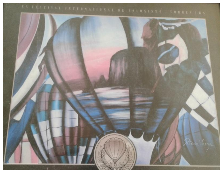
Figura 22. Capa de divulgação do Festival de balonismo.