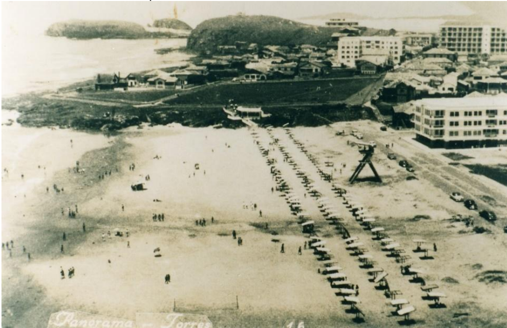
Figura 3. Vista aérea do município de Torres na década 1940.

Fonte: Acervo Casa de Cultura do Município de Torres, 2017.