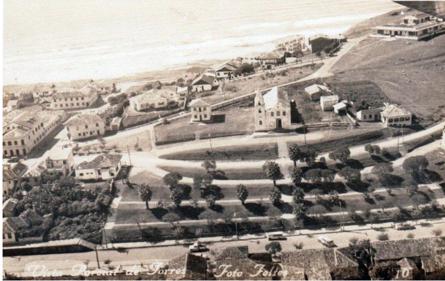
Figura 2. Povoamento de Torres na década de 1940.