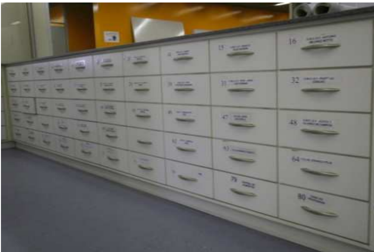
Figura 01: Gavetas da Secretaria do Sistema de Educação