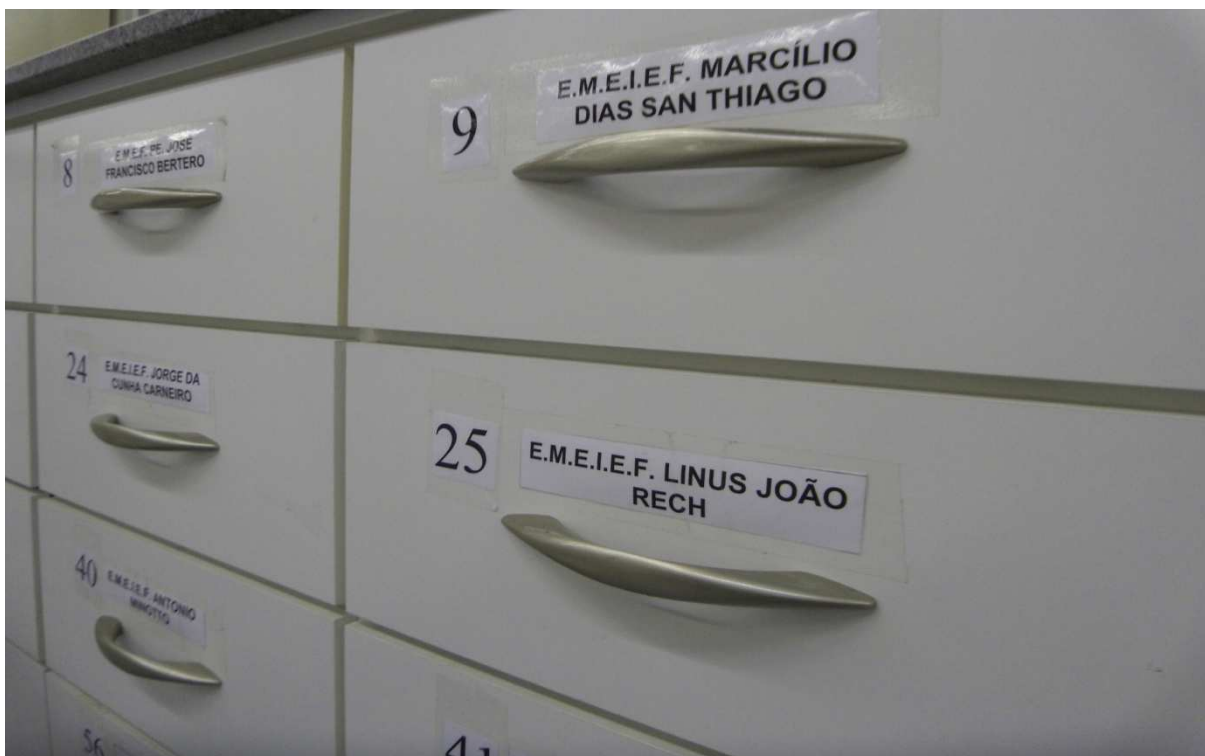
Figura 02: Meio de comunicação entre as escolas