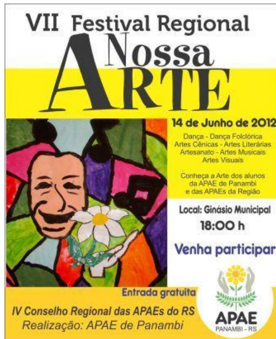
Figura 3: Cartaz do Festival Nossa Arte de Panambi/ RS