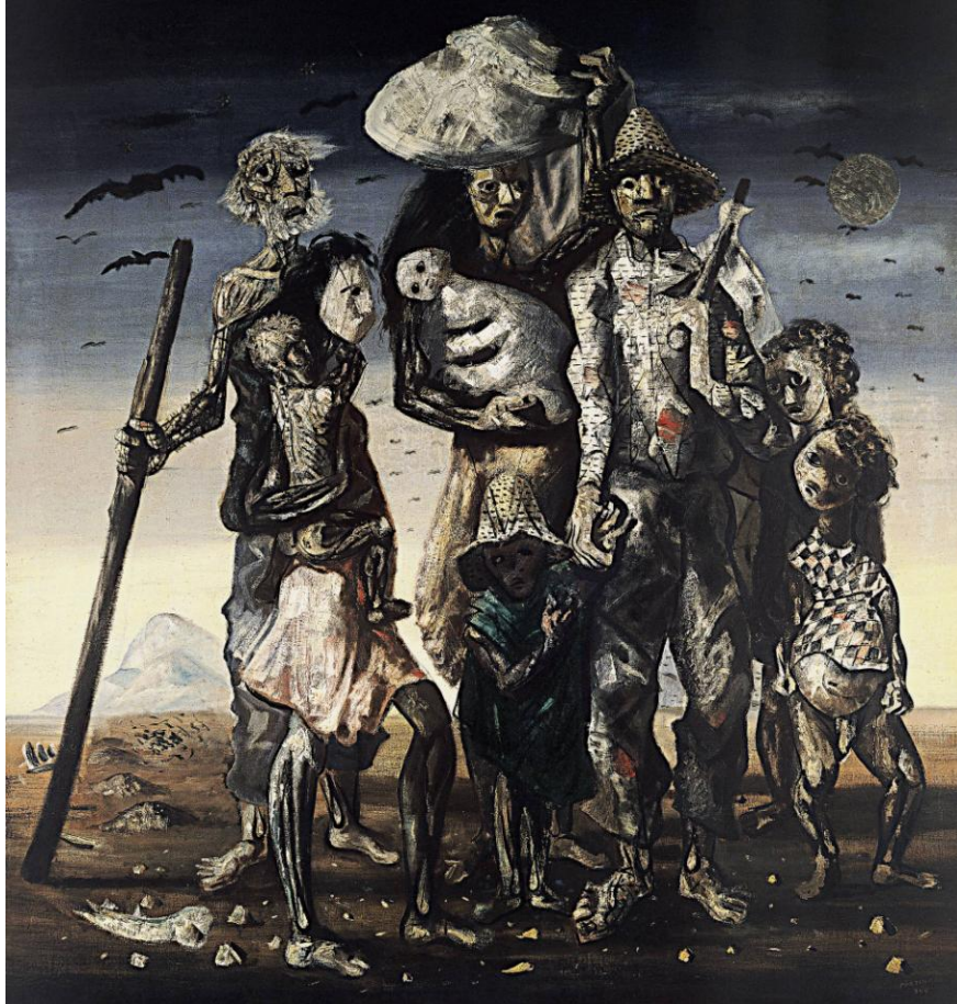
Figura 1: Obra Retirantes de Candido Portinari