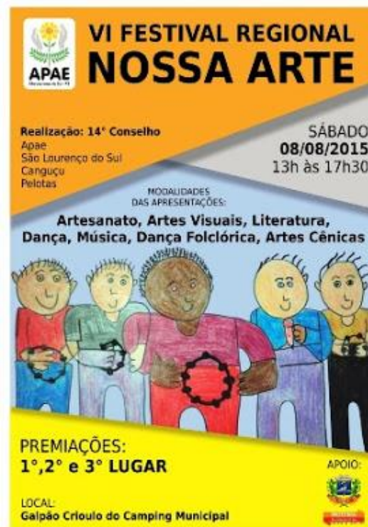
Figura 4: Cartaz do Festival Nossa Arte São Lourenço