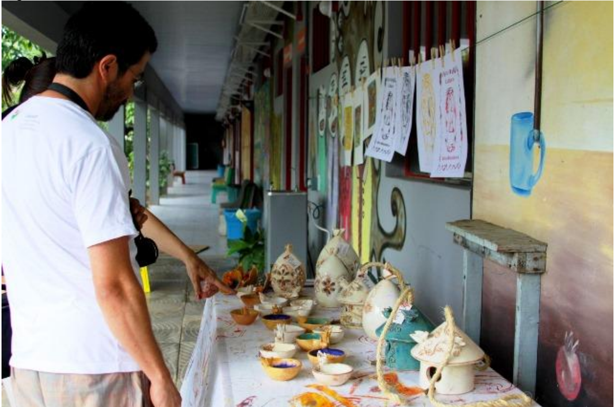
Figura 3 - Bloco Z - Ateliês do curso de Artes Visuais