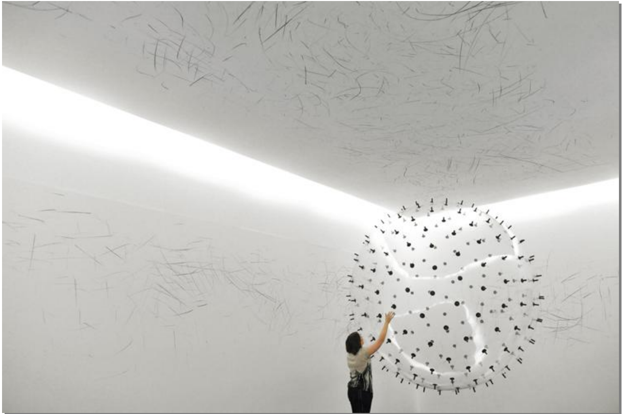
Figura 5 - ADA, analog interactive installation / kinetic sculpture – 2010.