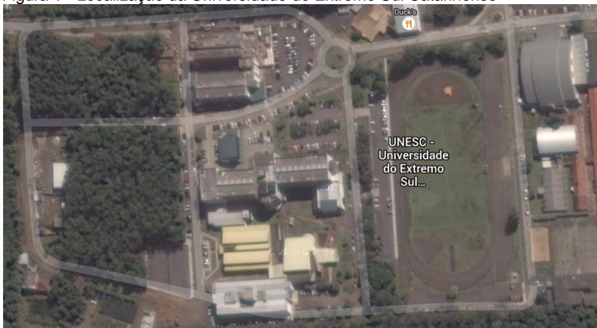
Figura 1 - Localização da Universidade do Extremo Sul Catarinense