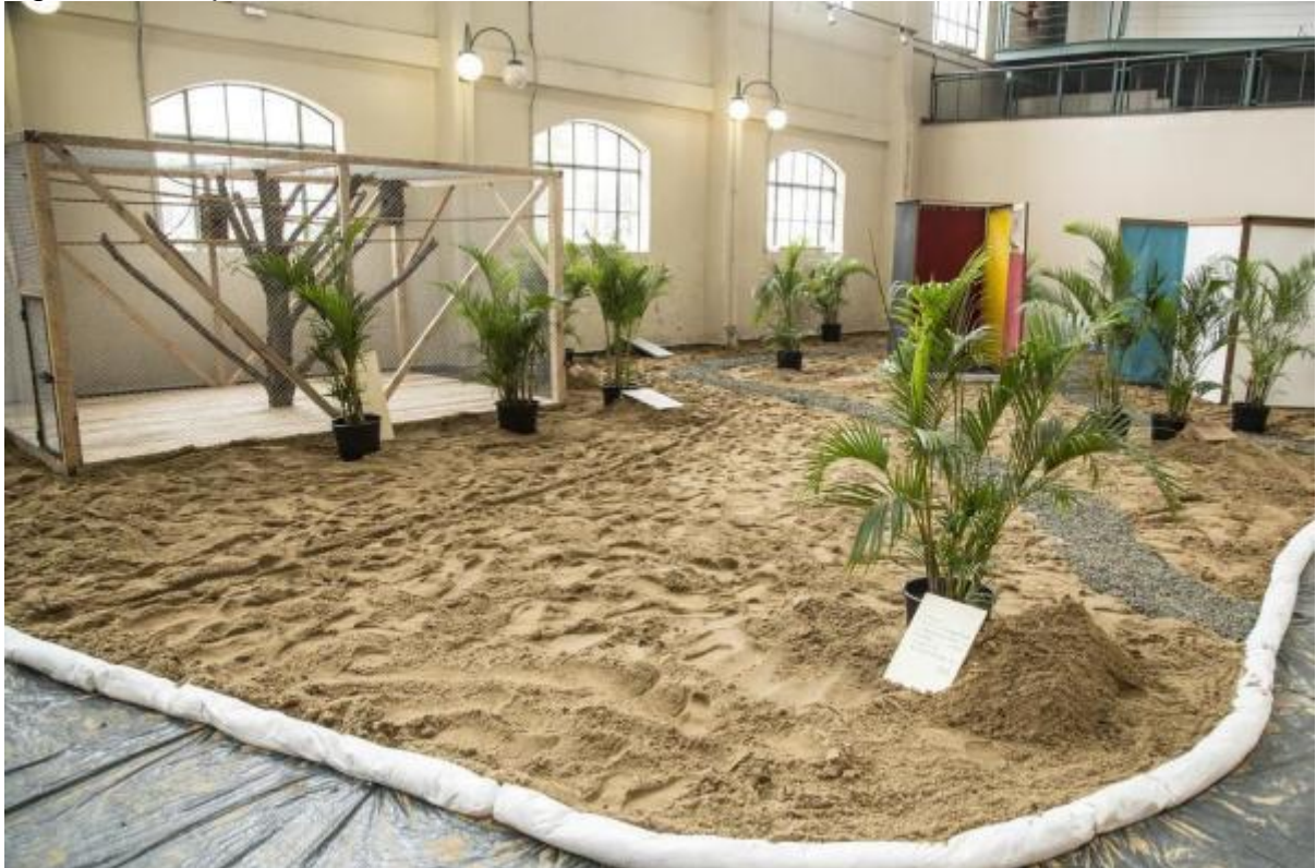
Figura 6 - Tropicália de Hélio Oiticica - 1967.