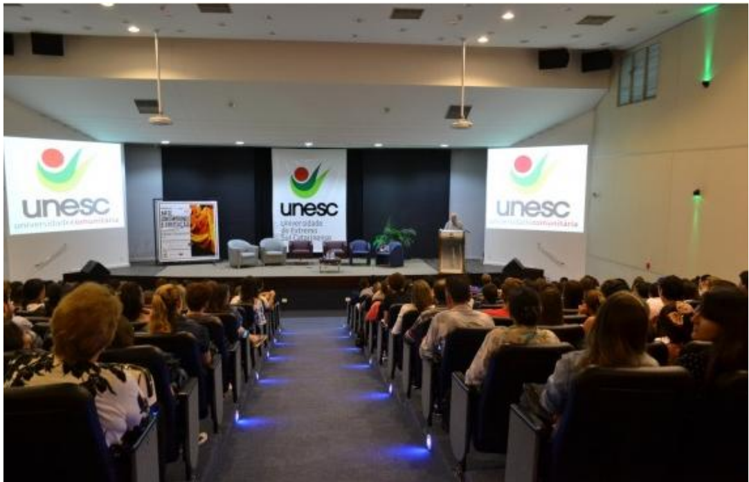
Figura 4 - Aula inaugural com o professor pesquisador Celso Favaretto referente aos 45 anos do curso