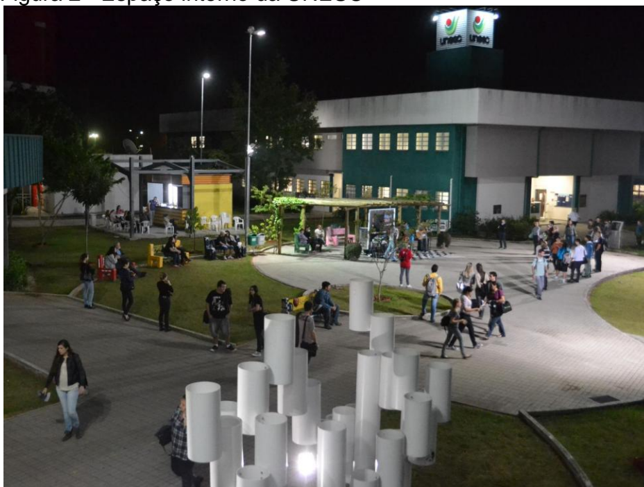
Figura 2 - Espaço interno da UNESC