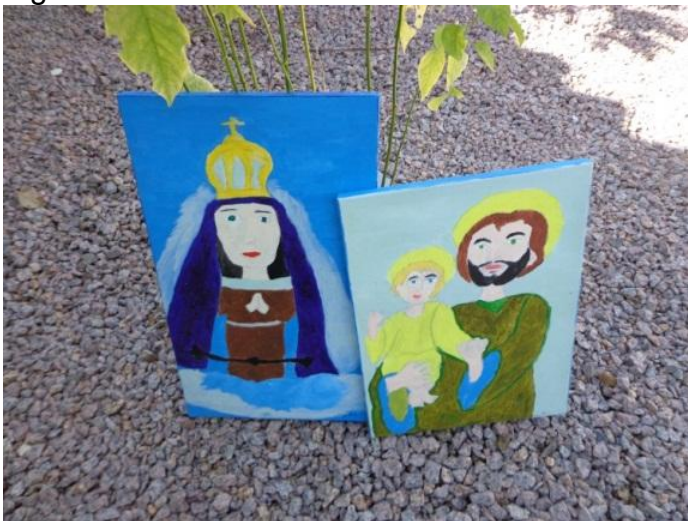
Figura 30 - Padroeiros

Em cada fase de nossas vidas, as mudanças acontecem. Minha sobrinha veio enchendo minha casa de amor e alegria. Ela aparece em alguns de meus trabalhos, porque vejo nela um dos sentimentos mais puros do ser humano: o amor.