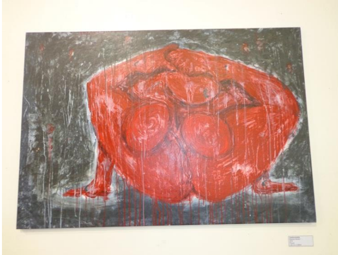
Figura 22 - Exposição UNESCO – Contorcionista – 2014 Pintura (0,90 cm x 0,98 cm)