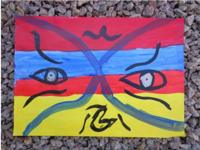
Figura 23 - Olhos Atentos