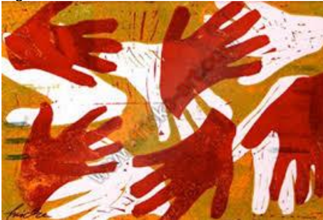
Figura 10 - Arte Surda