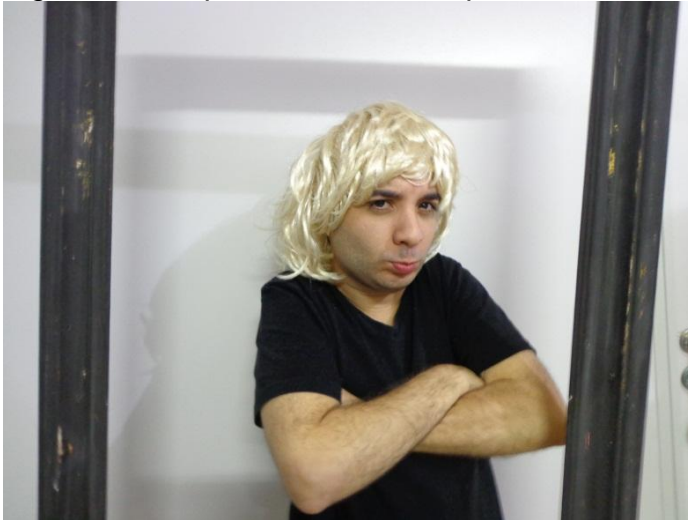
Figura 36 - Espelho Surdo: o corpo do artista