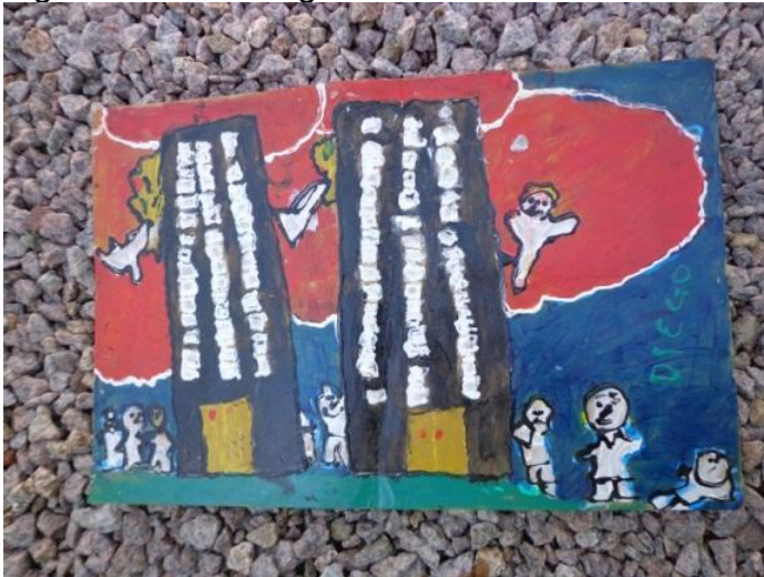
Figura 28 - Torres gêmeas

Este autorretrato segue a linha do leão, sou eu representando garra, força, beleza, agilidade. Este é um dos animais mais rápidos do reino animal, começo aqui a pensar em liberdade de expressão sem limites.