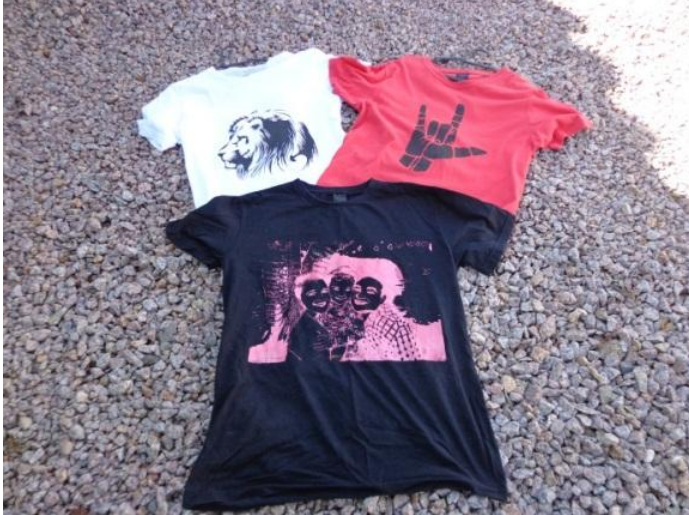
Figura 25 - Serigrafando

fotografei, demonstrei minha religiosidade, cultura, língua, identidade. Questões que me cercam e me constituem sujeito, como nas figuras 25 e 26: serigrafando e a figura 27 que chamo de autorretrato.