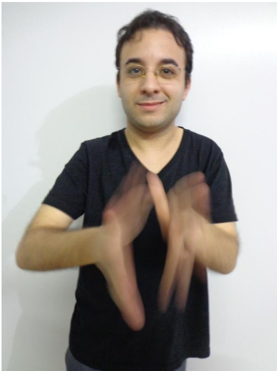
Figura 37 - Espelho Surdo: o corpo do artista