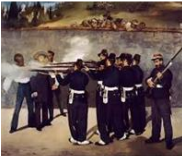
Figura 4 - Três de maio