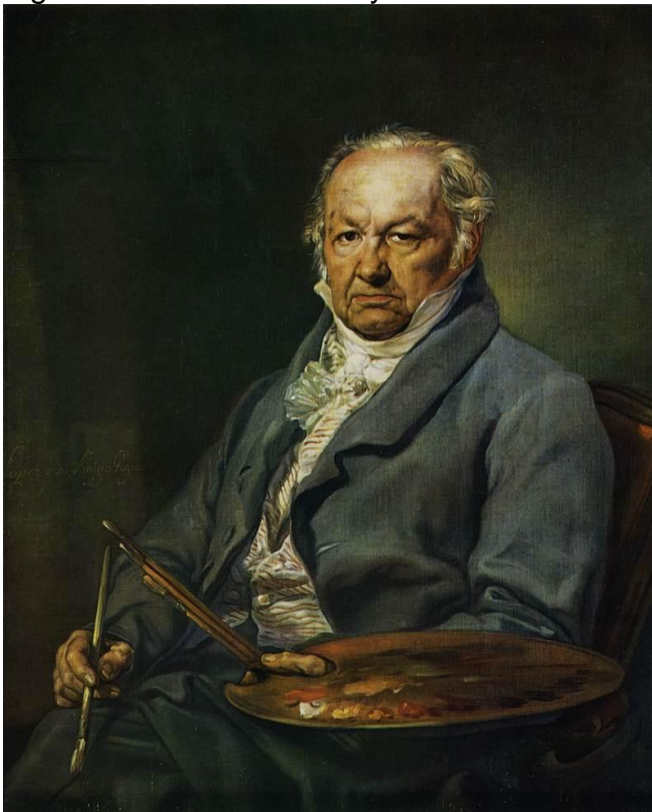
Figura 2 - Autorretrato Goya