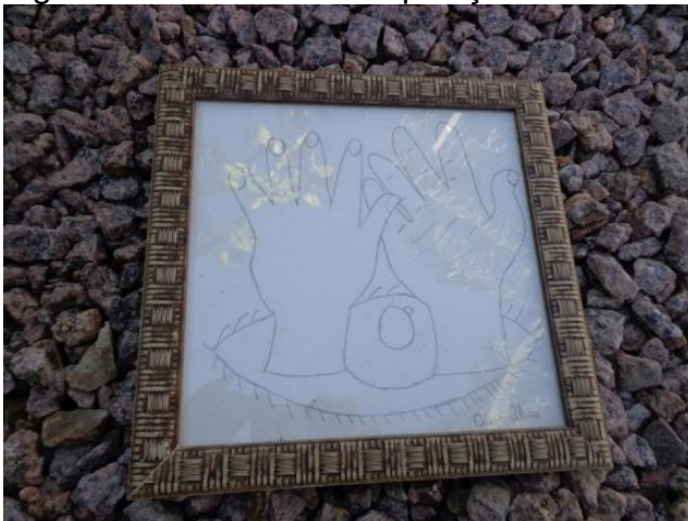
Figura 13 - : Desenho - Exposição “Somos”

Eis aqui o elemento chave de meu processo de criação; minhas mãos. Já no curso de Artes esses elementos vão se somando e as possibilidades de eu me fazer sujeito ativo nesse processo de construção vão se ampliando.