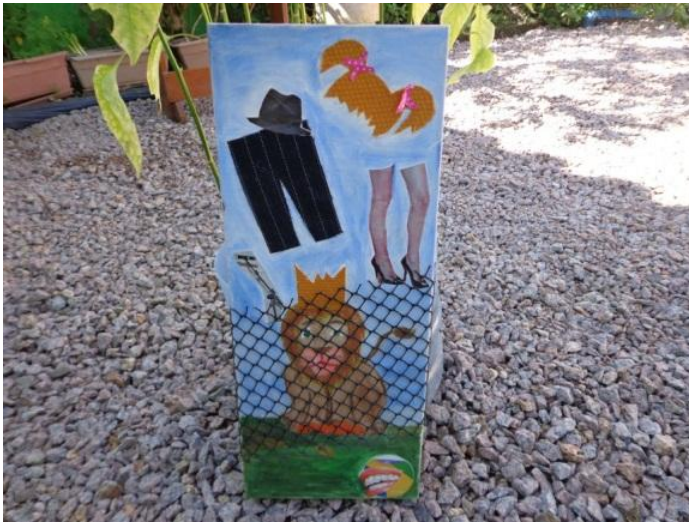
Figura 1 – Pintura e colagem sobre tela

durante o curso, me vejo – nessa experiência de representação da própria identidade com a figura do leão –no exercício de quebrar barreiras quando vejo uma grade que impede a passagem de um rei, um rei que encontra na selva um mundo de coisas que não lhe pertencem, mas que por direito vai criando o desejo de compreendê-las.