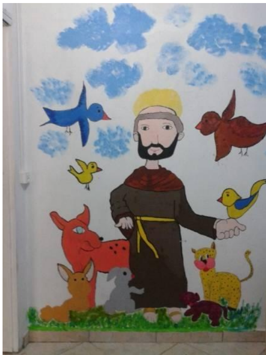
Figura 34 - São Francisco de Assis