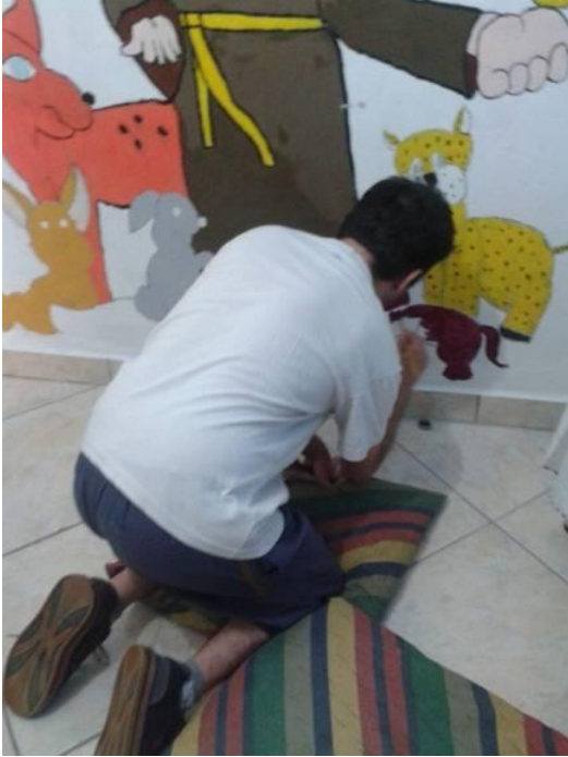
Figura 33 - São Francisco de Assis

Fonte: Acervo do autor(2015), Parede do meu quarto de praia.