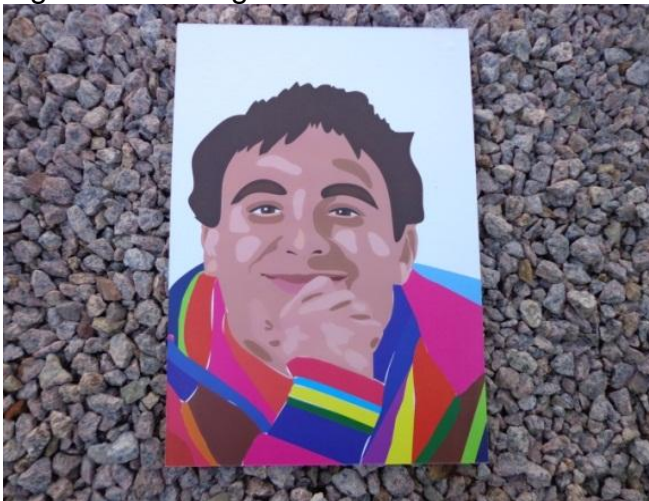
Figura 24 - Fotografia - Autorretrato

Olhos atentos foi um trabalho realizado na disciplina de pesquisa e pintura, na qual tive a possibilidade de experimentar diferentes pincéis, texturas e espessuras diferentes. Olha eu aí de novo, tentando romper com as barreiras que me impedem de prosseguir.