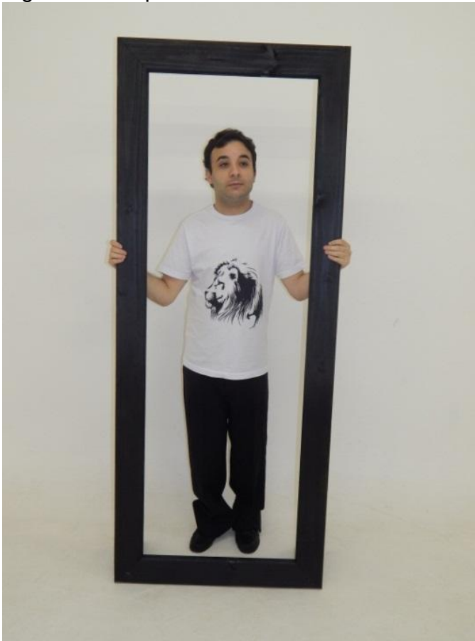
Figura 38 - Espelho Surdo

Em minha camiseta serigrafuei a figura do leão e trago ela em minha obra como em outras que fiz, porque ele sempre me atraiu em suas características biológicas (animal forte, rápido, imponente, poderoso, rei dos animais). Ocupa um espaço de liderança em seu grupo, onde chega impõe respeito, é determinado. Mas o que mais gosto no leão é os olhos que observam, traçam um objetivo, um foco e vai a luta, persegue sua presa até conseguir. Ele se comunica com os olhos e com o corpo, assim como eu.