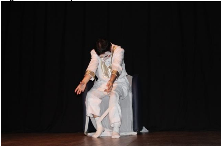
Figura 19 - Dança - Teatro

Outra forma de linguagem na qual fui protagonista foi a dança-teatro na disciplina de Linguagem Teatral e Educação, onde tínhamos como proposta de trabalho criar uma coreografia tendo como elemento efetivo o elástico. O objetivo era experimentar movimentos, passos, expressões que demonstrassem toda a emoção necessária para o tema que defini como: o despertar para a vida. Foi o momento de explosão de conhecimentos e emoções que estão retratadas em vídeo e nas figuras 19 e 20.