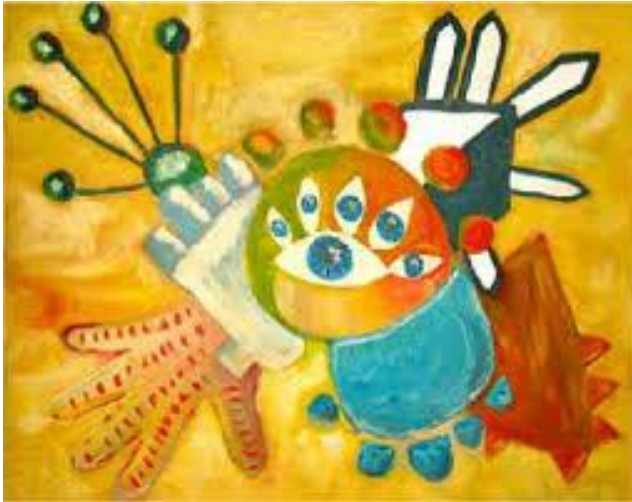
Figura 9 - Arte Surda