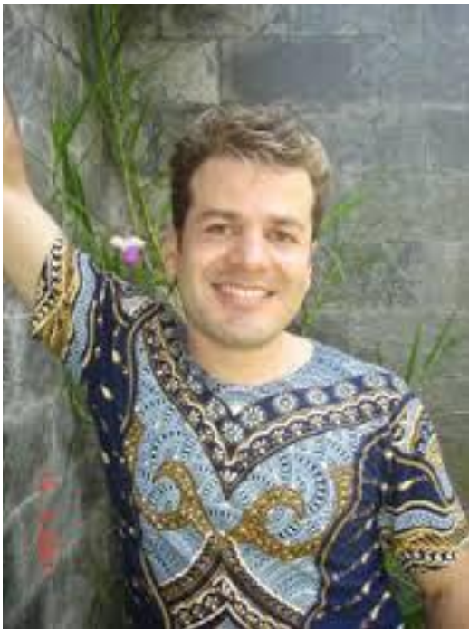
Figura 5 - Foto Marcos Anthony

Fonte: http://www.artelista.com/autor.php?a=6978942344780854&offset=2 .