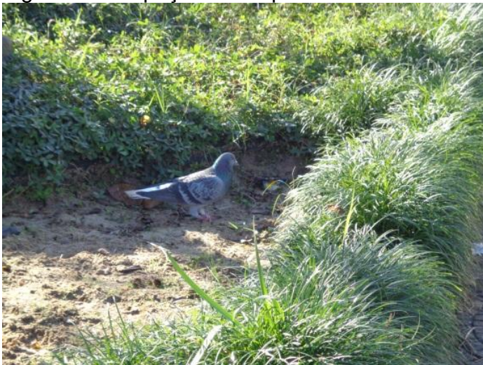
Figura 16 - Espaço do campus Universitário