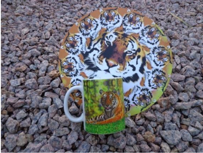
Figura 27 - Autorretrato