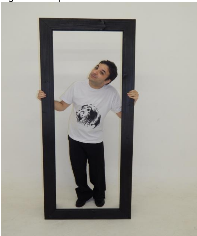
Figura 40 - Espelho Surdo