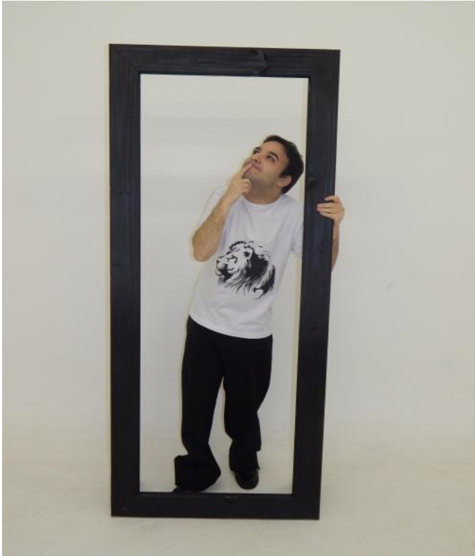
Figura 39 - Espelho Surdo