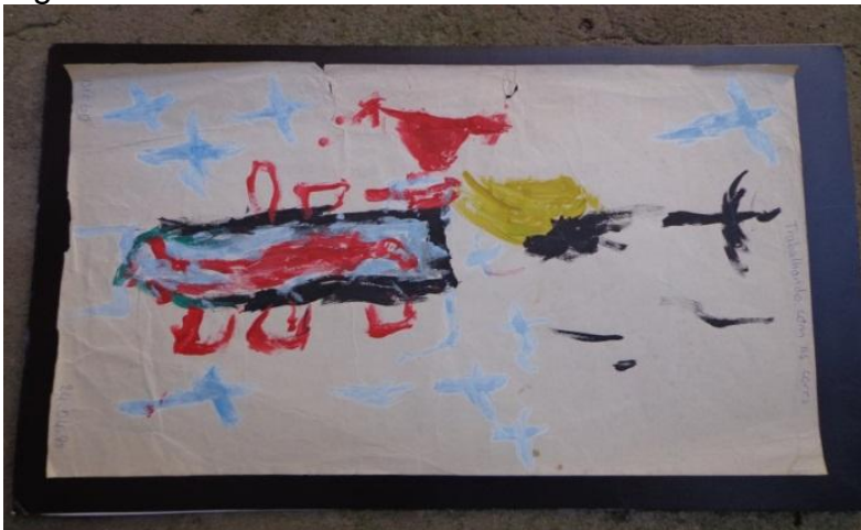
Figura 12 - Funeral de minha bisavó

Como compreender esse mundo, a subjetividade nesse universo que muitas vezes me é apresentado pela linguagem oral, a qual eu não consigo me apropriar por completo? Como materializar a ideia de vida e de morte? O que e como isso me toca no processo de me constituir sujeito? Na figura 12 remeto-me a um momento em que tento materializar o que ainda me é incompreensível: a morte. Trago em marcas de tinta a representação do funeral de minha bisavó como algo que faz parte de mim.