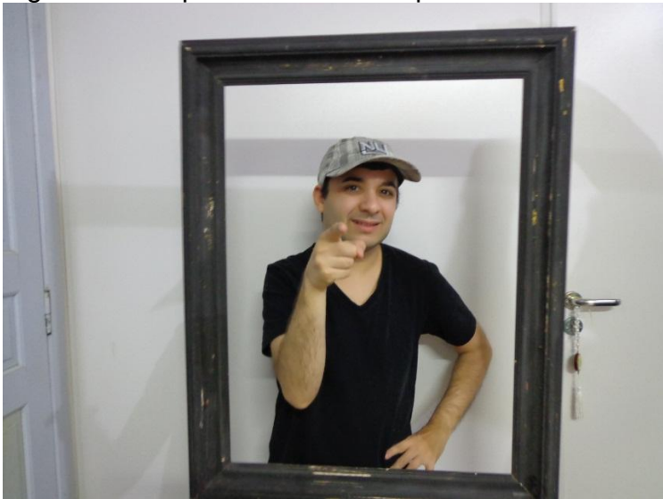
Figura 35 - Espelho Surdo: o corpo do artista