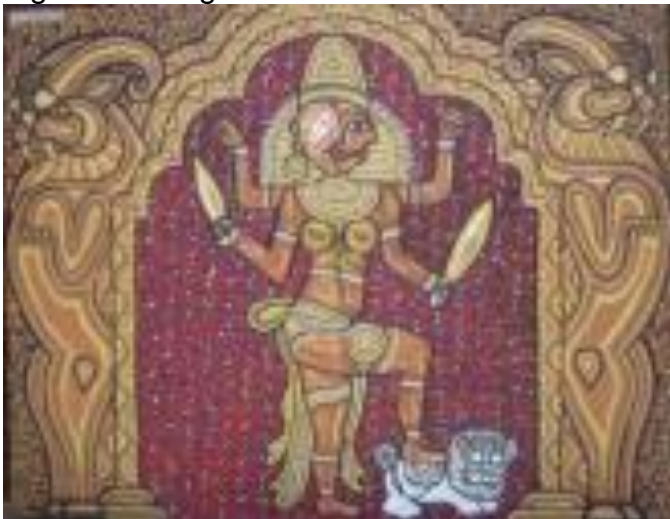
Figura 7 - Os guardiões