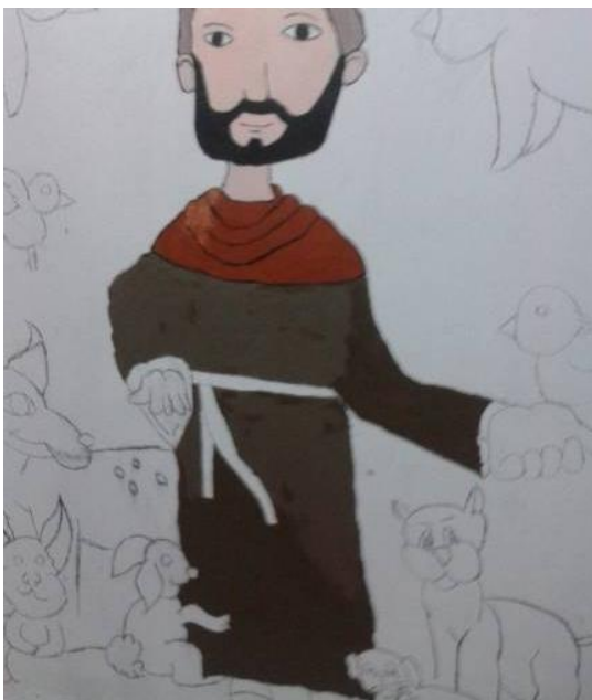
Figura 32 - São Francisco de Assis - Paredes do meu quarto de praia.

Esta produção utiliza a técnica da pintura com luz, demonstrando a beleza do aproveitamento da luz na fotografia. Nesta, contornei meu corpo com luz, rompendo a barreira externa na tentativa de deixar reluzir a essência do corpo interno.