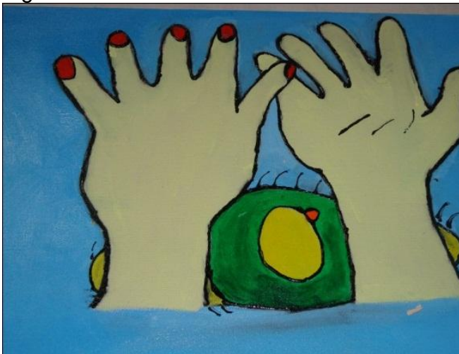
Figura 14 - Obra Somos