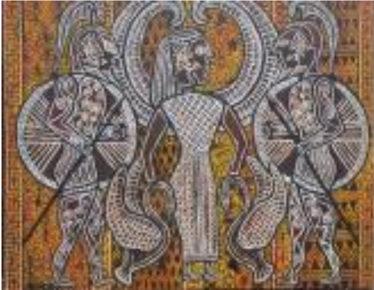
Figura 6 – A deusa dos animais e os guerreiros