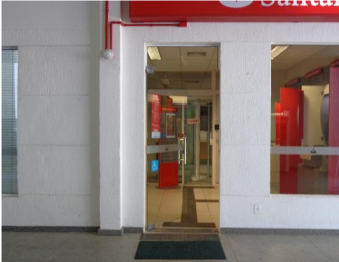
Figura 15 - Espaço do campus Universitário