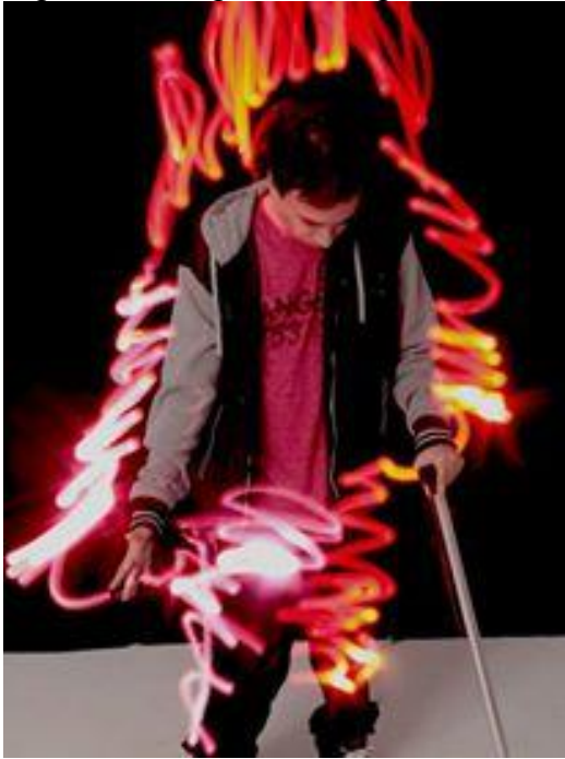
Figura 31 - Light Painting