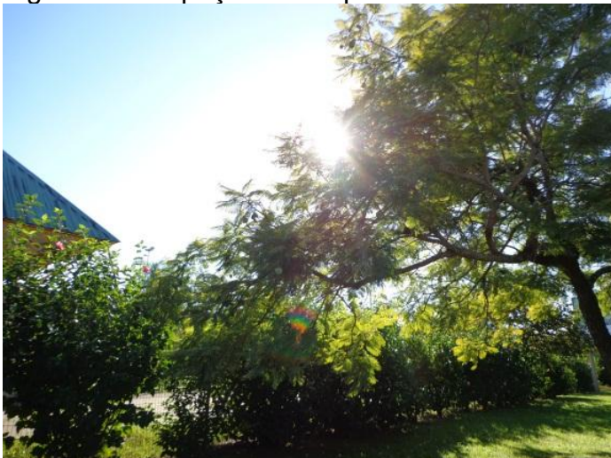
Figura 17 - Espaço do campus Universitário