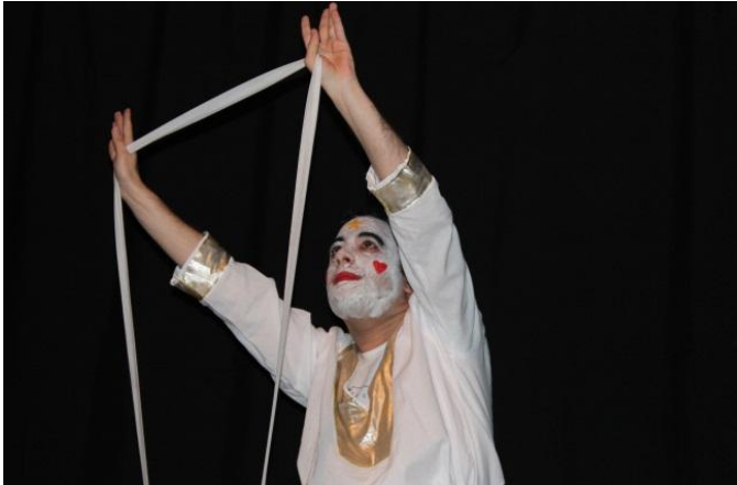
Figura 20 - Dança – Teatro