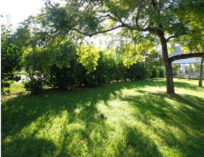
Figura 18 - Espaço do campus Universitário