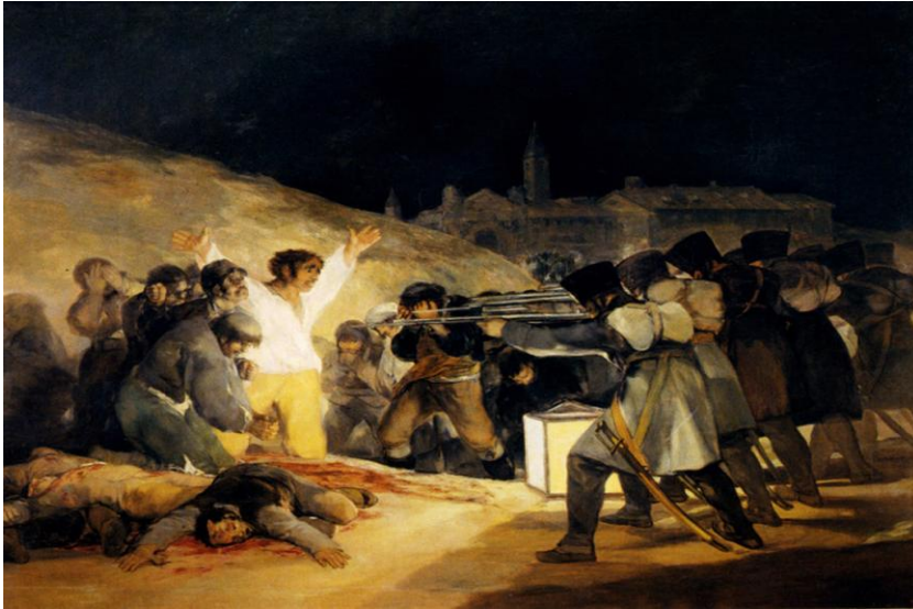
Figura 3 - Fuzilamento de 8 de maio de 1808