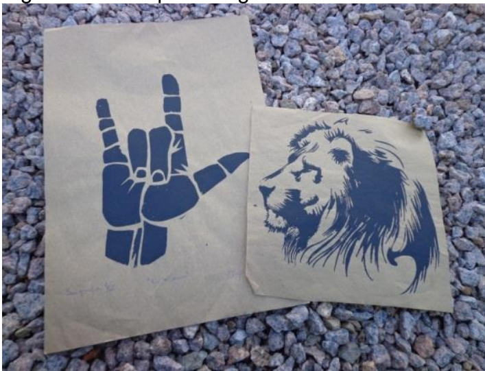
Figura 26 - Croqui - Serigrafando

O exercício da serigrafia foi muito interessante. Buscava sempre trazer e criar desenhos já utilizados em meu processo acadêmico. A figura do leão que me representa em alguns momentos, agora sem grades. A Libras como a língua do surdo que utilizo e faço questão de divulgar, é parte de minha família, que representa minha base enquanto ser humano.