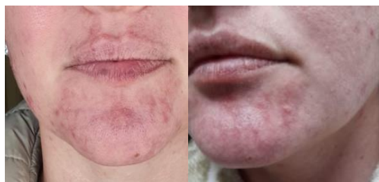
Figura 6 - Imagens do 10º dia de tratamento

A partir do 8º dia de tratamento a sensação de dormência havia desaparecido e havia uma melhora no aspecto do lábio e mento. No entanto, as erupções cutâneas na área do queixo permaneceram até o 10º dia do tratamento, observado na figura 6 a seguir.