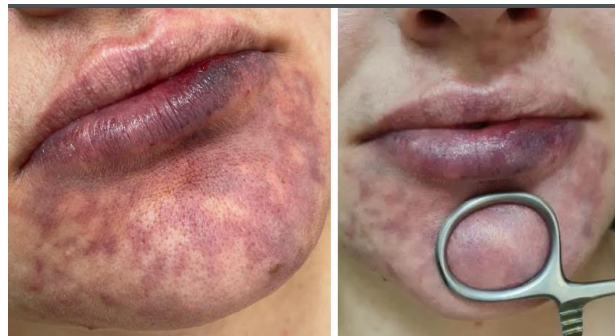
Figura 3 - Final do ciclo I de aplicação de hialuronidase