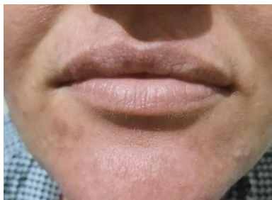
Figura 7. Imagem do 30º dia pós intercorrência