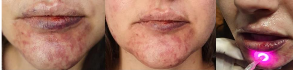
Figura 5 - Imagens do 1º e 2º dia de tratamento uso tópico e aplicação de laser

Com a paciente realizando o tratamento medicamentoso de forma correta, nota-se melhora na coloração do lábio (figura 5), e região de mento em processo de recuperação. Paciente não relatou dor.