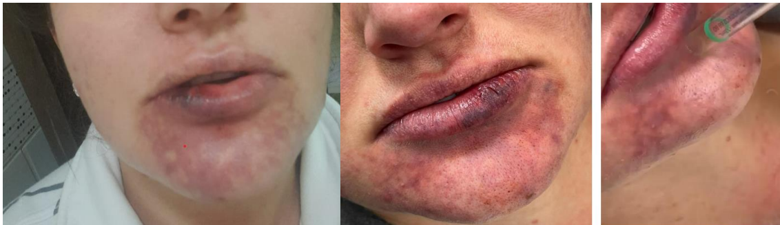
Figura 4 – Região de mento com possível isquemia e imagens finais do ciclo II de aplicação de hialuronidase