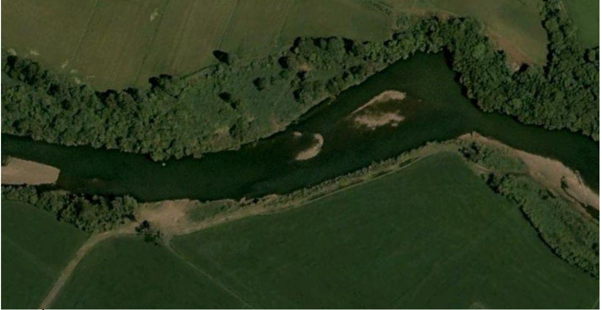
Fig.3. Área de supressão da vegetação ciliar.