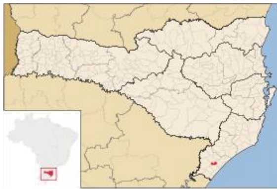
Fig. 1. Local do estudo.

A área de estudo compreende os municípios de Meleiro, Turvo e Ermo, que pertence à microrregião do vale do Araranguá. Esses municípios têm o arroz irrigado como principal cultura e fonte de arrecadação, os municípios também tem plantações de feijão, maracujá, milho, fumo e está investindo na criação de aves.